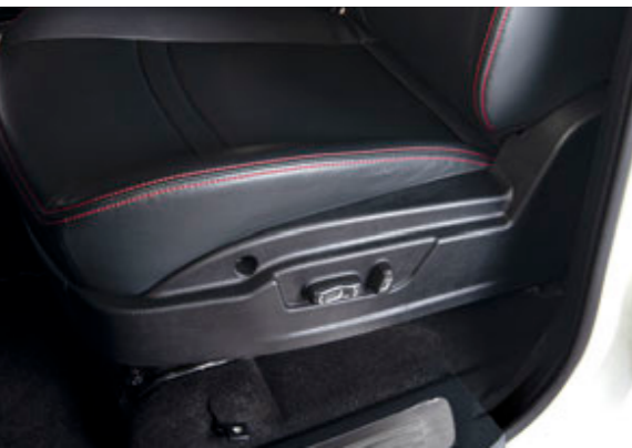
صندلی راننده با تنظیم برقی در ۶ جهت