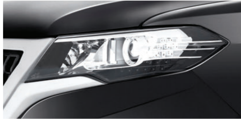
چراغهای جلو هالوژن