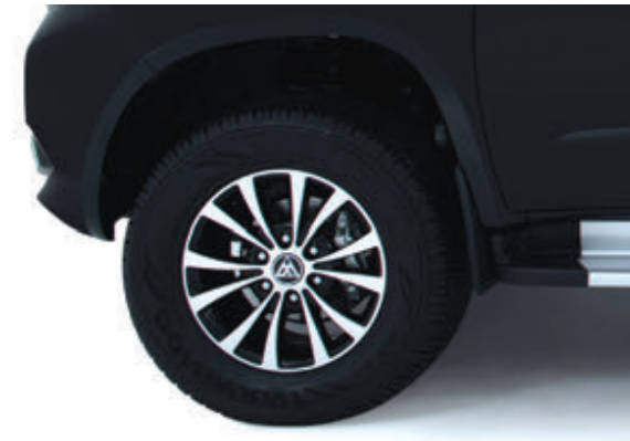
رینگ آلومینیومی ۲۴۵/۷۰R۱۷