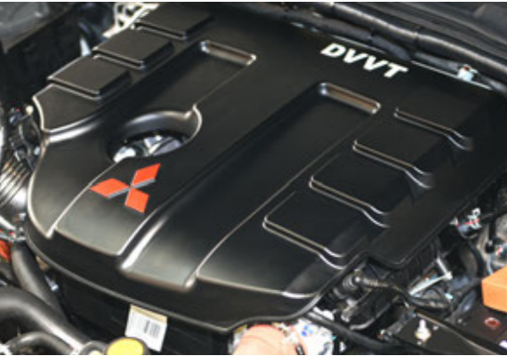
موتور ۲/۴ لیتر توربوشارژر میتسوبیشی