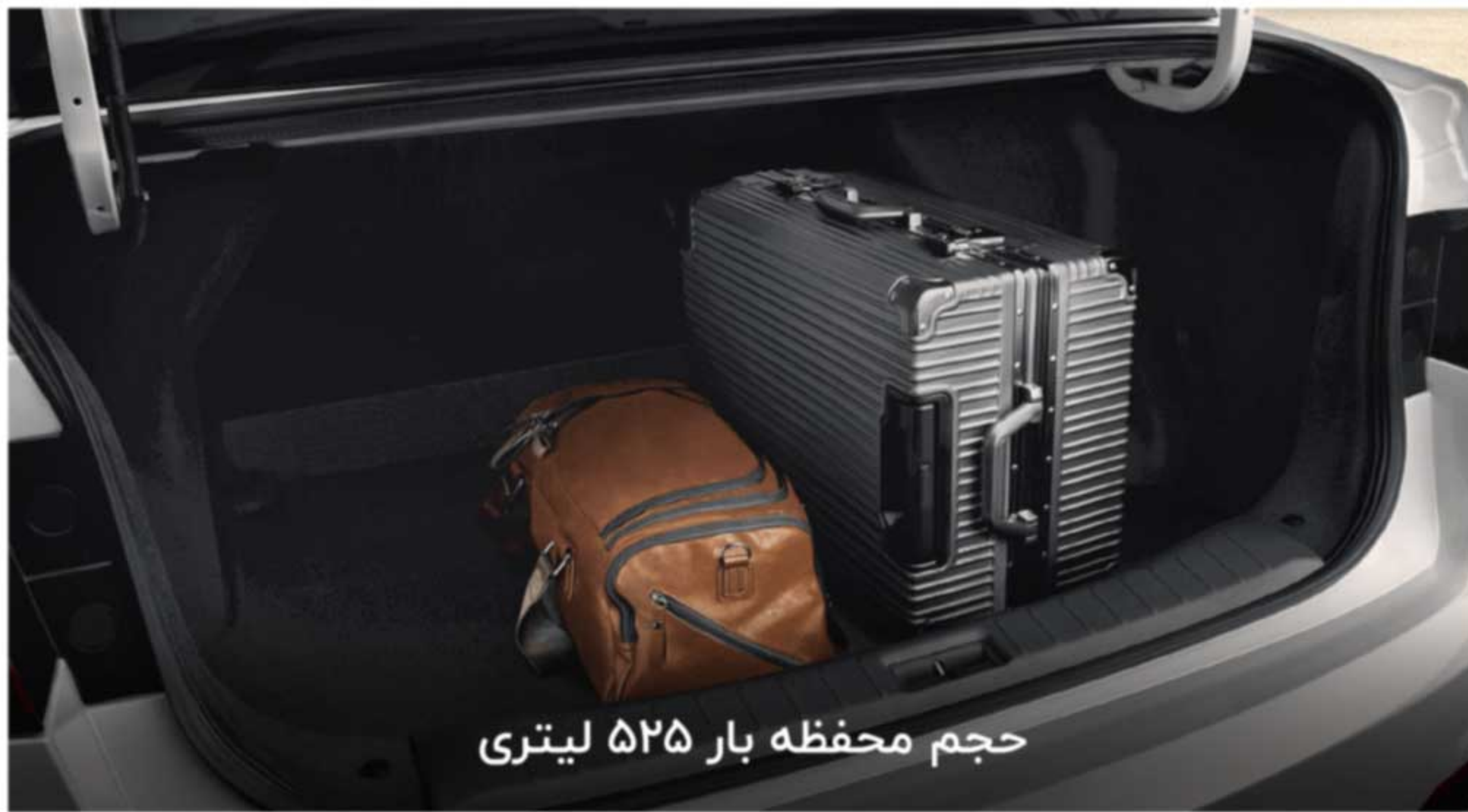
حجم محفظه بار ۵۲۵ لیتری