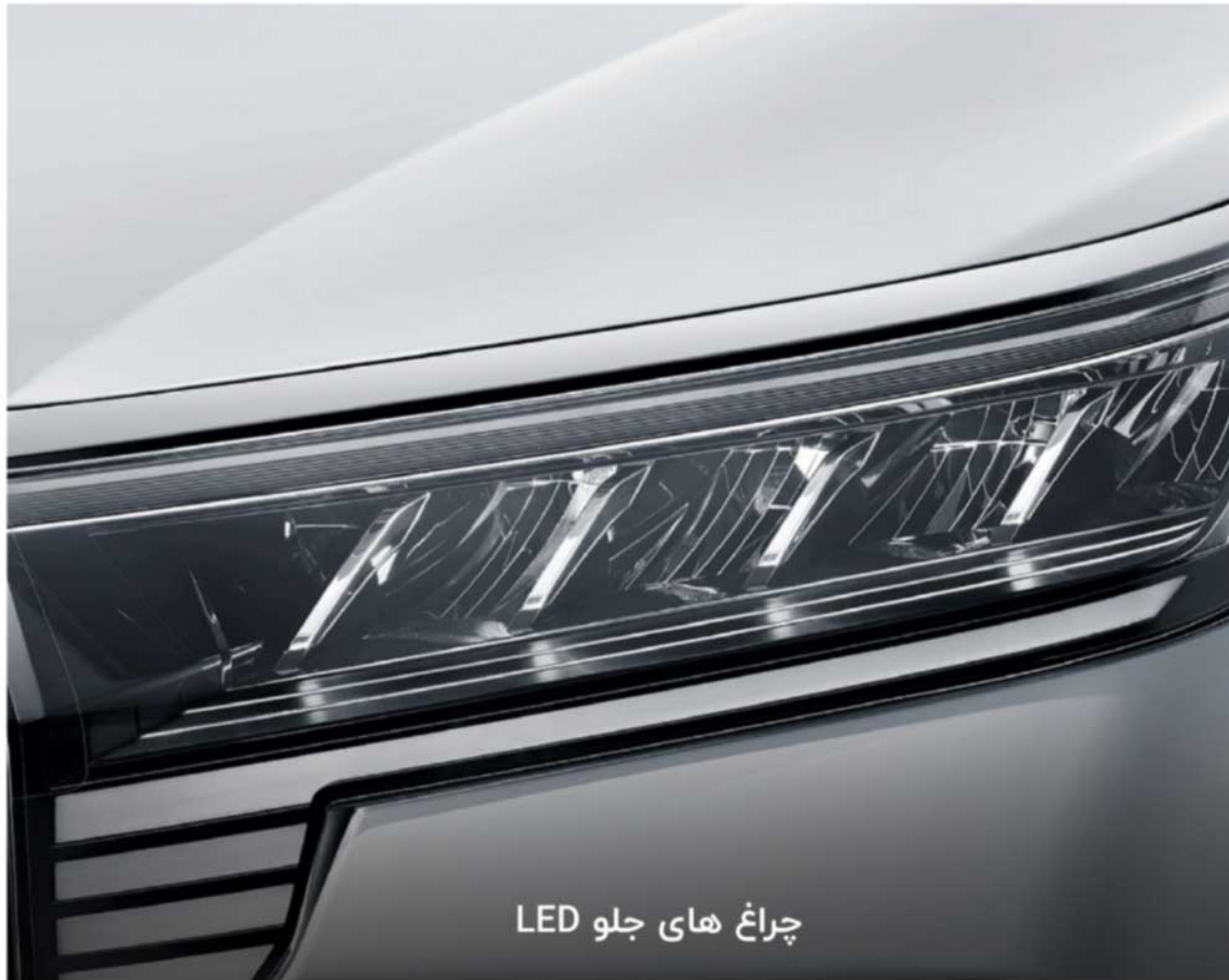
چراغ های جلو LED