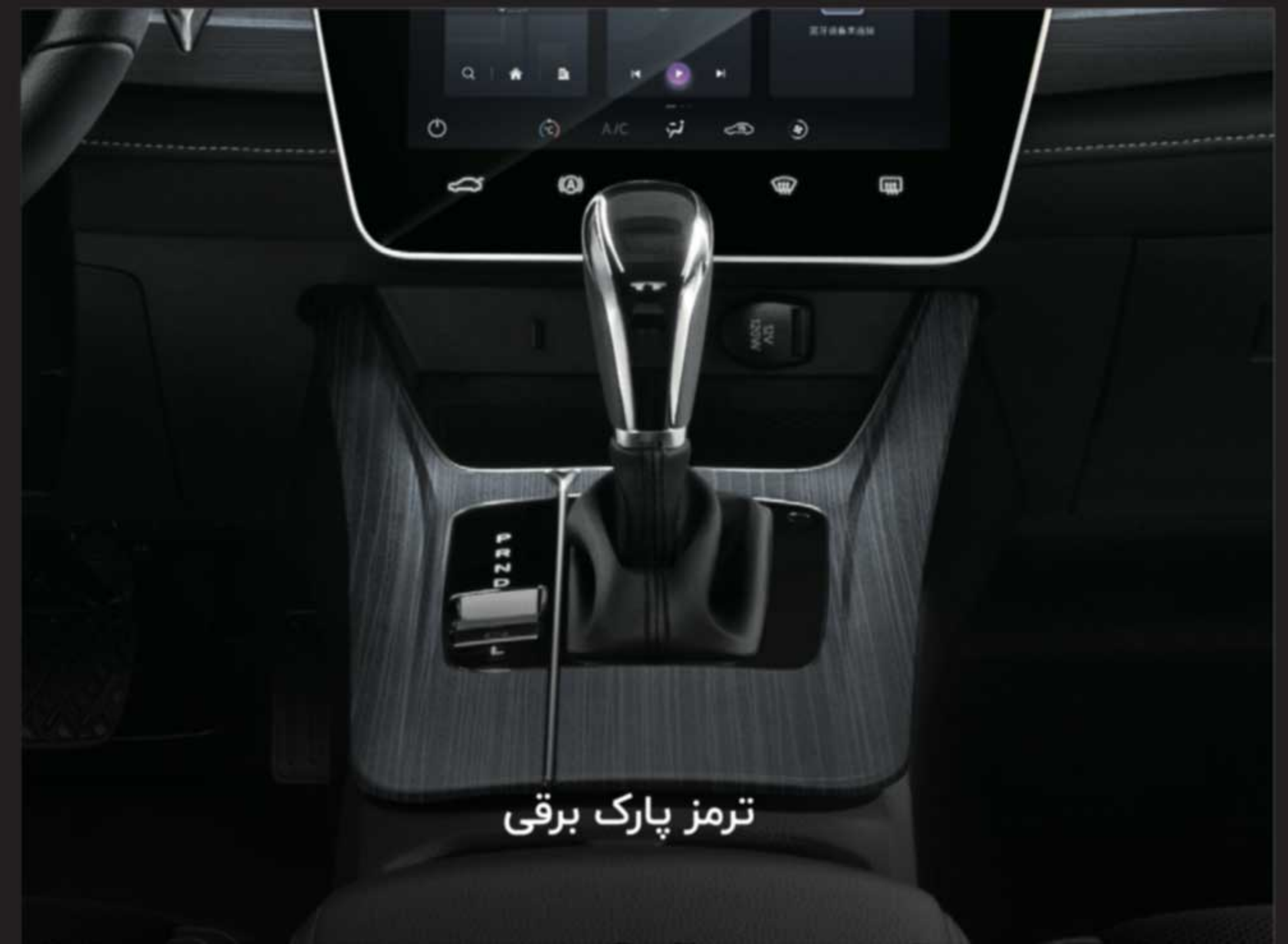
ترمز پارک برقی