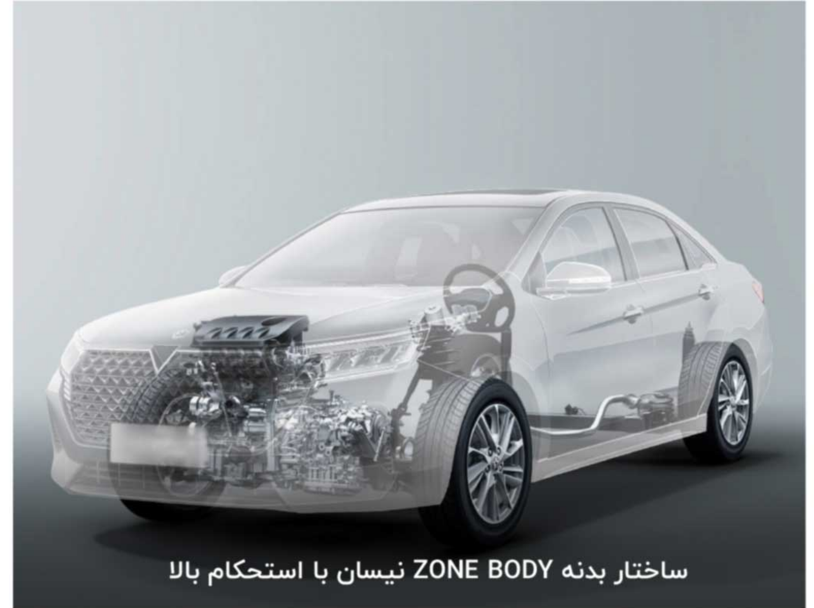
ساختار بدنه ZONE BODY نیسان با استحکام بالا