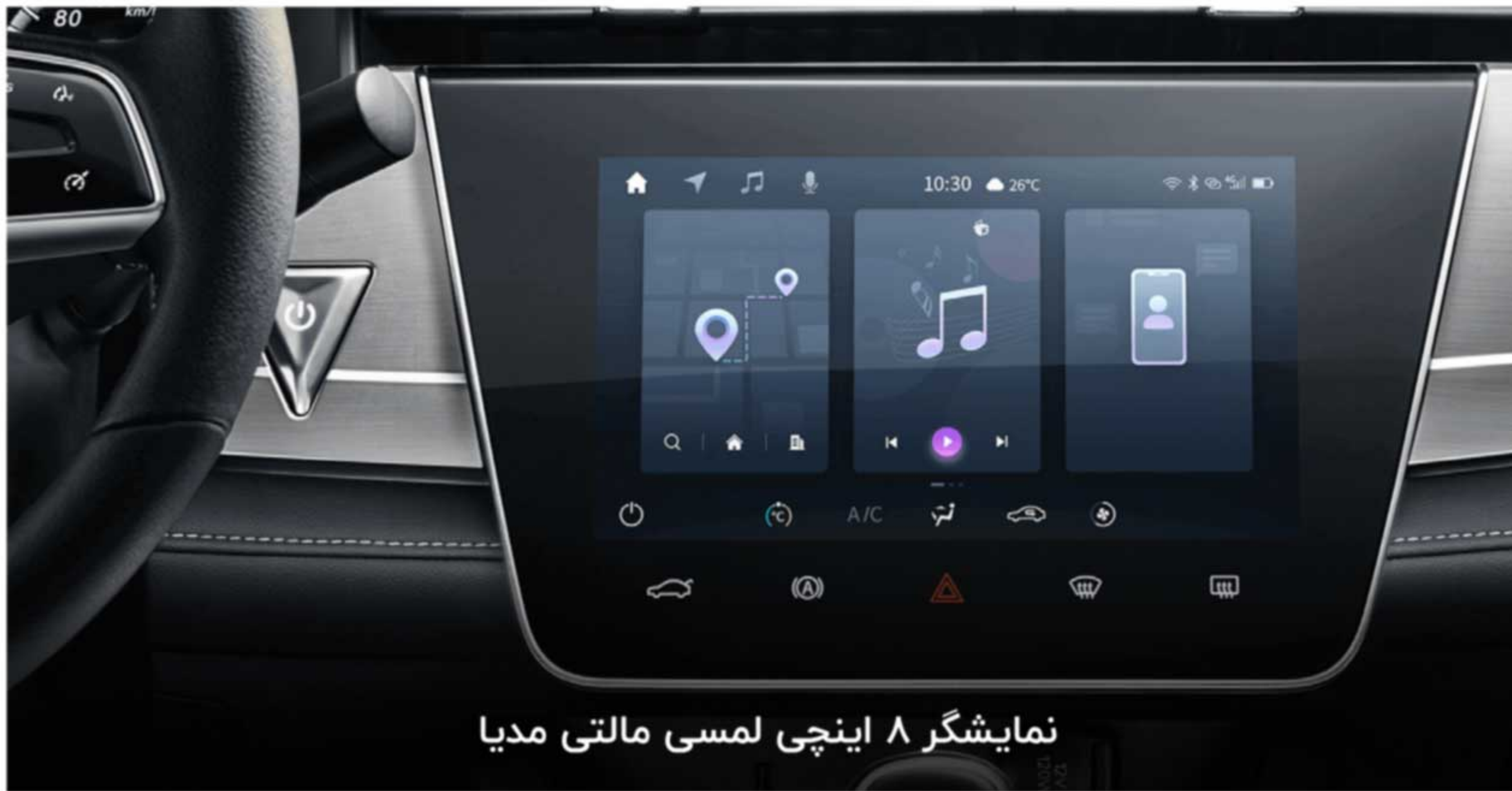
نمایشگر ۸ اینچی لمسی مالتی مدیا