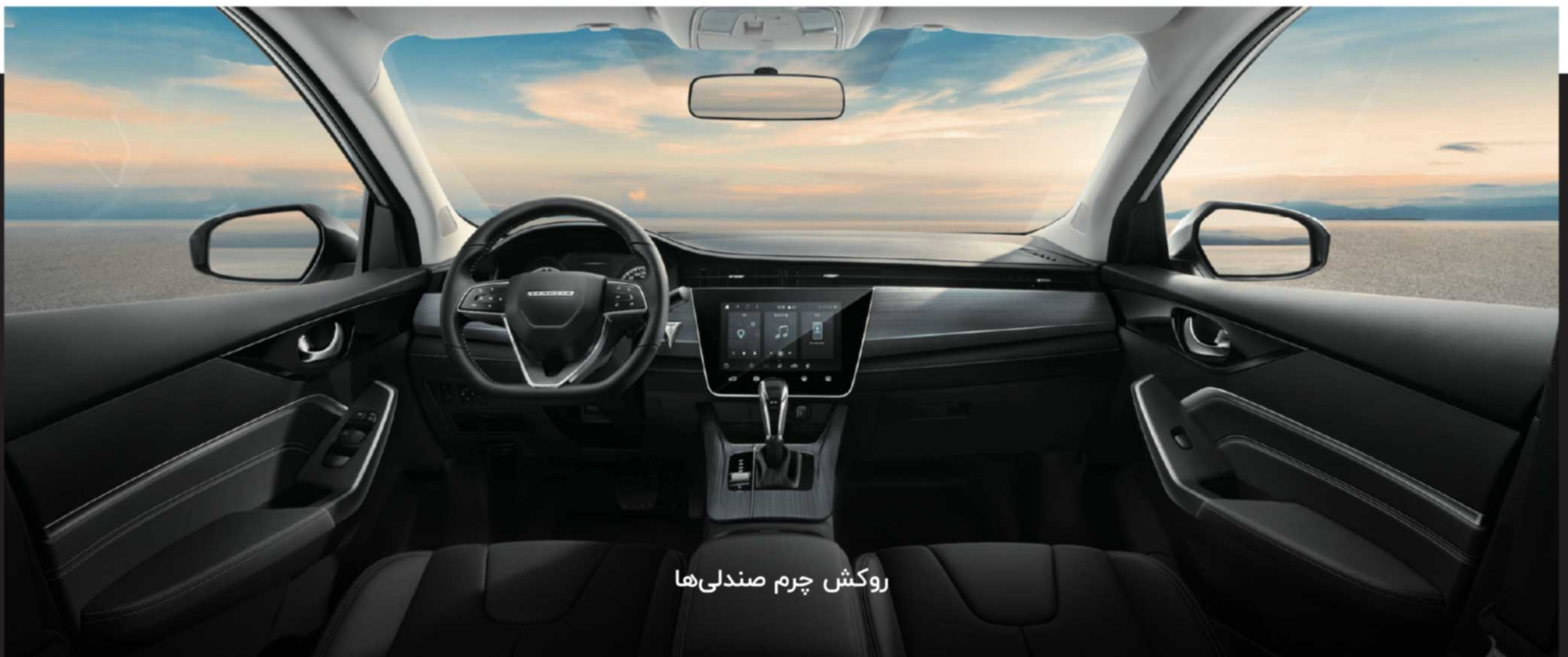
روکش چرم صندلی‌ها